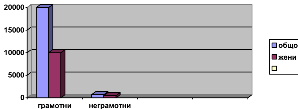
Фиг.2. Грамотност на населението на 9 и повече навършени години по пол

Като проблемни области се очертават големият брой на хора с начално, незавършено начално образование, както и тези, които никога не са посещавали училище и високото ниво на неграмотност. С най-висок дял по тези показатели са хората от ромски произход. Необходимо е да се предприемат мерки за повишаване грамотността за възрастни и разнообразяване на възможностите за квалификация, за да са конкурентоспособни на пазара на труда.